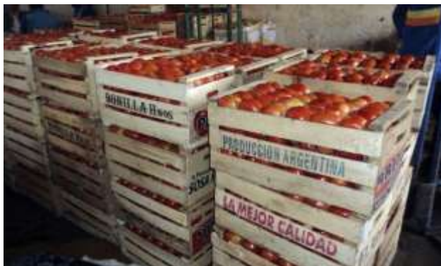
Tomate nacional en cajas argentinas, en el bloque del MAG, en el Abasto, con descartes en el fondo.

Prohíben importación de hortalizas y los precios se disparan, lamentan -- La importación de tomate y locote está terminantemente prohibida y, debido a la menor oferta, los precios de ambos productos en el mercado interno se dispararon, en detrimento de los intereses de los consumidores.